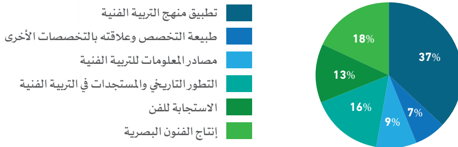
شكل (١) الوزن النسبي لمجالات التربية الفنية